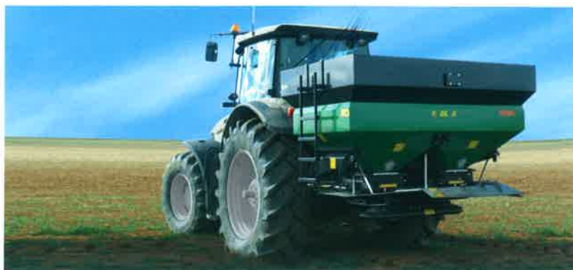
Abonadora GIL de doble disco, modelo Jolly; de 18-24 m de trabajo, capacidad de hasta 3.000 l, de gran uniformidad y capaz de trabajar con los abonos más finos, y fabricada en sus partes esenciales en acero inoxidable.

Double disc fertilizer spreader Gil, model Jolly: fertilizer spreader with working width 18-24 m, capacity till 3.000 l, large fertilizing uniformity and quality with thin fertilize, and it's manufactured mainly in inox.