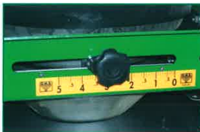
La apertura progresiva hace posible la dosificación de cualquier tipo de abono con calidad.

Épandeur d'engrais GIL avec double disque, modèle Jolly; épandeur d'engrais pour 18-24 m de largeur de travail, capacité jusqu'à 3.000 l, avec une grande uniformité et qualité de épandage inclus avec engrais poudre, et fabriqué principalement en acier inoxydable.