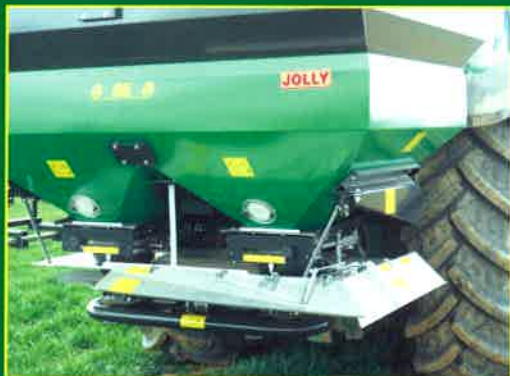
Kit de abonado en la linde. Kit to work in the border. Kit pour l'épandage au bord.