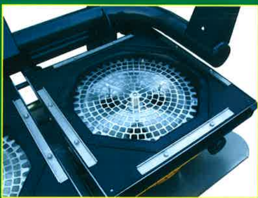
Sistema vibratorio. Vibro System. Système vibratoire.