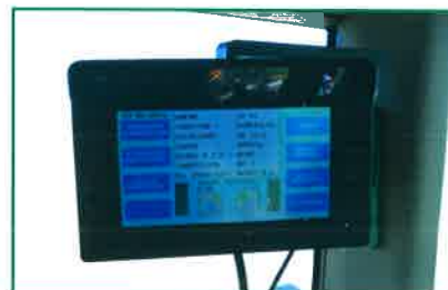
Kit para abonado proporcional al avance.

Ouvertures à géométrie variable qui permet une courbe de dosage que satisfasse aux exigences d'épandage.