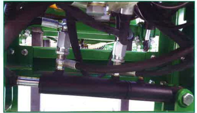
Bloqueo Hidráulico y corrector de pendientes.

Hydraulic blockage and pending correction.