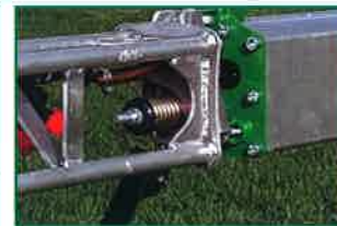
Punteras con sistema de retorno.