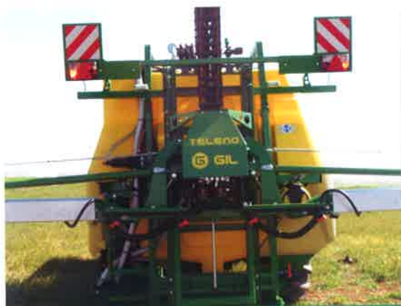
Chasis fabricado en acero de alto límite elástico, pintura de poliuretano sobre base granallada.

High quality frame and polyurethane paint.