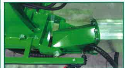
Barras en perfil de aluminio con articulaciones reforzadas y casquillos autolubricados.

Bars in aluminum with articulations reinforced and self-lubricating bushing.