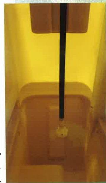
Sistema de limpieza interior. Inside cleaning system. Système de nettoyage intérieur.