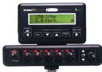
Ordenador con dosis proporcional al avance con antena GPS. Computer with dose proportional to the advance with GPS aerial. Ordinateur avec dosage proportionnelle à l'avance avec GPS capteur.