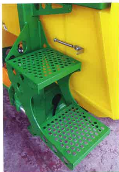
Peldaño de acceso. Rung. Passerelle.

Chassis en acier de haute élasticité et peinture polyuréthane.