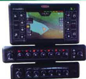
Ordenador con corte automático de tramos. Computer with automatic sector nulling. Ordinateur avec découpe automatique de sections.