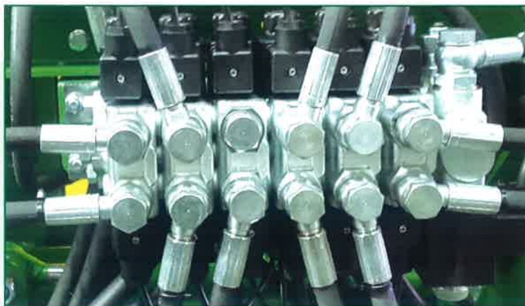
Mando electrohidráulico para manejo con un único mando del tractor.

Electrohydraulic control to work with one tractor distributor.