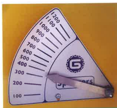
Indicador de nivel. Level indicator. Indicateur de niveau.