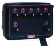
Mando eléctrico Electrical control. Commande électrique.