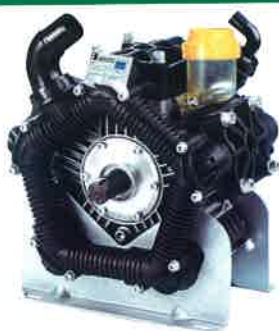
Bomba de membrana de baja presión y alto caudal, preparada para abono líquido. Diaphragm pump low pressure and high flow, ready for liquid fertilize. Pompe à membrane basse pression et haut débit, préparé pour l'engrais liquide.