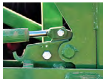
Cerros hidrúulicos de transporte Boulons de transport hydraulique Hydraulic transport bolts