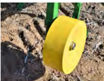
Rueda Metálica Roue en métal Metal Wheel