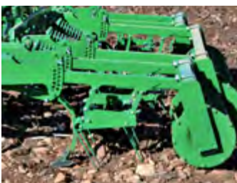
Rastra delante del rulo Herse devant le rouleau Harrow in front of the roller

Cultivator equipped with elastomers for the shallowest tillage (even less than 10 cm). Perfect for conservation agriculture and carbon footprint reduction.