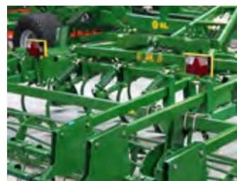
Luces LED de transporte Lumières de transport à LED Transport LED lights