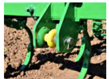
Enganches rápidos por bulón Attelage rapide par boulon Hooking up by bolt