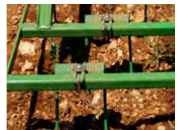
Rastra en 2 y 3 filas Herse à 2 et 3 rangs 2 & 3-row harrow