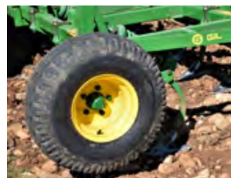
Rueda Neumática 10.0/80-12 Roue pneumatique 10.0/80-12 Pneumatic Wheel 10.0/80-12