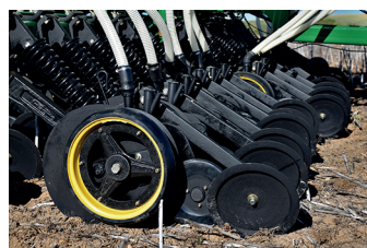
Rueda de radios (opcional). Roue à rayons (option). Spoke wheel (optional).