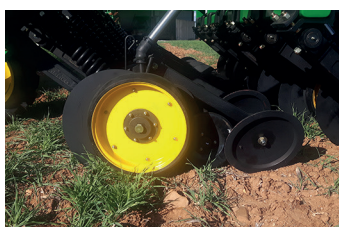
Elemento de siembra con rueda limitadora de profundidad, rueda compactadora y rueda tapadora.

Éléments de semis avec roue limitatrice de profondeur (roue de jauge), roue de compactage et roue de fermeture de sillon.