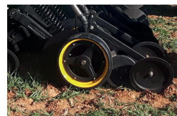
Rueda aprieta semillas de hierro (opcional). Roue de compactage en acier (option). Iron seed squeeze wheel (optional).

El fabricante se reserva el derecho de introducir variantes sin previo aviso. Le fabricant se réserve le droit d'introduire des modifications sans avis préalable. The producer reserve the right to introduce modifications without previous warning.